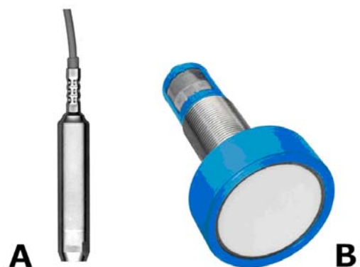
A. Sensori di pressione; B. sensori ad ultrasuoni

La sonda è alloggiata in un contenitore di protezione con la membrana sensibile posizionata esternamente verso la superficie del pelo libero. È necessario un supporto in acciaio inox, adeguatamente rinforzato a evitare momenti flettenti (che altererebbero HS), per posizionare il sensore ad almeno 1 m dal bordo. Campo misura: 60.6000 mm; uscita: 0.10 V. Risoluzione: 0.18 mm Frequenza ultrasonica: 80 KHz