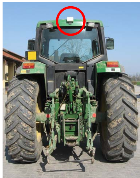
In rosso la posizione ottimale del ricevitore di codice

I test di campo hanno permesso di scegliere tra due differenti potenze di trasmissione ( LOW e HIGH ) e di determinare la migliore posizione del dispositivo ricevente su TR. In sintesi, la potenza HIGH si è dimostrata più affidabile in termini di affidabilità di trasmissione, mentre la posizione più idonea sul trattore è risultata quella con il ricevitore fissato sul lato posteriore della cabina: in questo modo è possibile ricevere senza ambiguità i codici trasmessi da MO accoppiate sia posteriormente sia anteriormente.